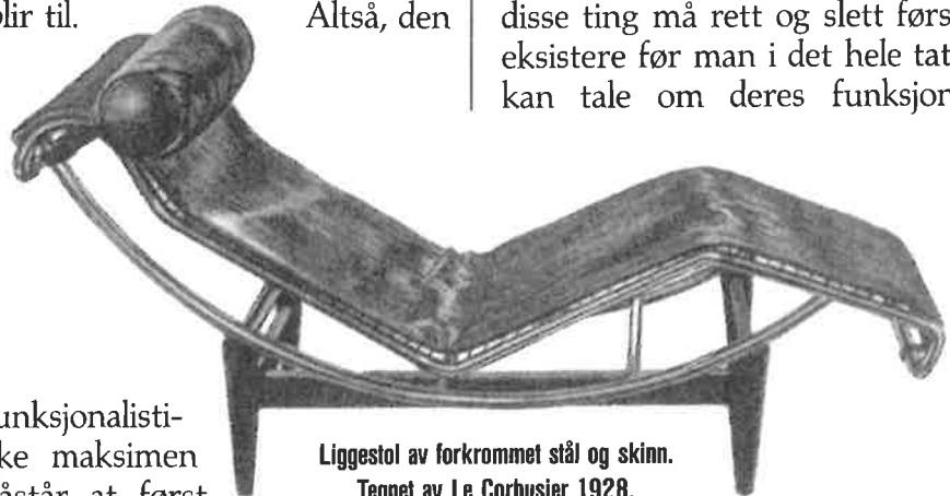
Liggestol av forkrommet stål og skinn. Tegnet av Le Corbusier 1928.

diskusjonene, med meget få unntak (Pye 1978), blitt betraktet som lite problematisk. Vi har alle hatt en tendens til å overse at i setningen form følger funksjon skjuler det seg en merkelig påstand – nemlig at funksjon kommer foran form, at funksjon er noe som eksisterer uavhengig av form, at den fins før formen blir til. Altså, den