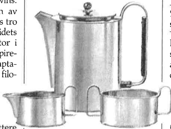
Kaffesett i sølvplett, tegnet av H.P. Jacobsen, Danmark, 1937. Fra Jørnæs.

Men ikke engang Darwin var helt entydig. Darwins egen språkbruk var fremdeles ambivalent, til forskjell fra dagens darwinisme. I forbindelse med utviklingen av organer taler han om «conversion from one function to another». Men et annet sted