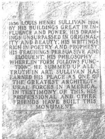
Minneplakett over den amerikanske funksjonalisten og arkitekten Louis H. Sullivan.

I Europa var disse idéene ikke ukjente. Den sveitsiske arkitekten Gottfried Semper regnet funksjon som en av formens determinanter i sitt teoretiske